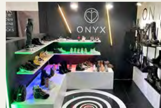
MICAM FAIR - ONYX