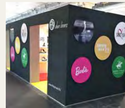
EXPO RIVA SCHUH