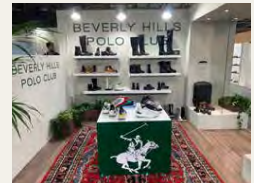
MICAM FAIR - BHPC